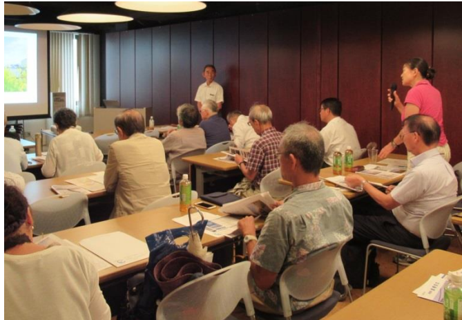
会員からの質問シーン↑