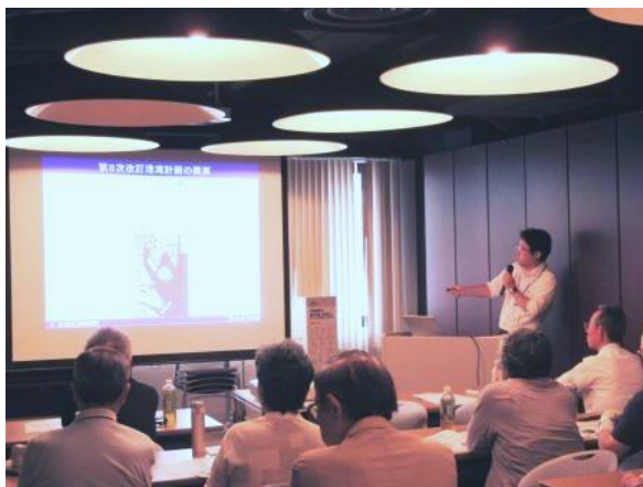
①「東京港の施設計画について（オリンピック施設も含む）」