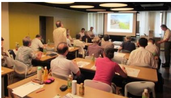
会員からの質問シーン↑

■ 質疑内容は、「港湾局の範囲が広いので、それぞれの局との関係性などについての質問、水質や水流などについて汚泥の浚渫について、2020年の大会競技場など水質改善について」の質問のやり取りが行われました。