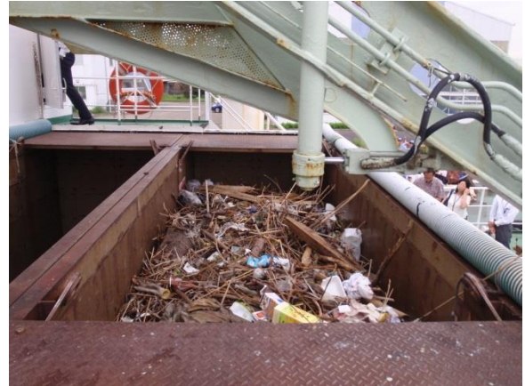
「べいくりん」によって回収された浮遊ゴミ