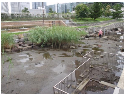
高島水際線公園 (干潟部の葦は自然に生育したもの)