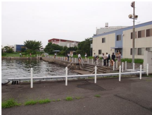
潮彩の渚を見学する参加者

私たちが行った時は潮位が高い時間となったため、「潮彩の渚」の干潟を見ることができませんでしたが、映像等で詳細な説明をして頂きました。