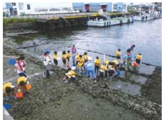
「潮彩の渚」を活用した小学校環境学習 (見学会配布資料より)