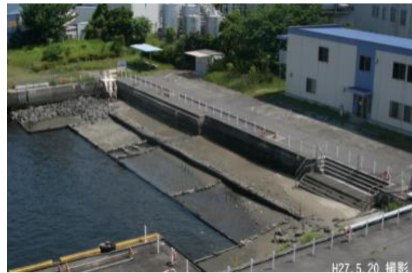
潮が引いた時の潮彩の渚

「潮彩の渚」は、研究機関との協定による協働調査や、一般に公開して、市民向け生物調査の実施、近隣小学生の環境学習の場としても提供されています。