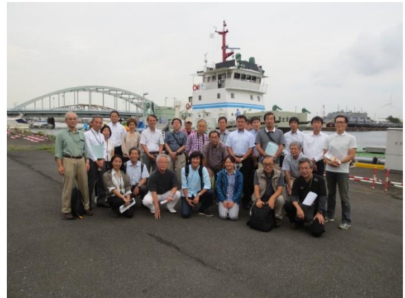
見学会最後に「べいくりん」をバックに集合写真（お疲れ様でした。）