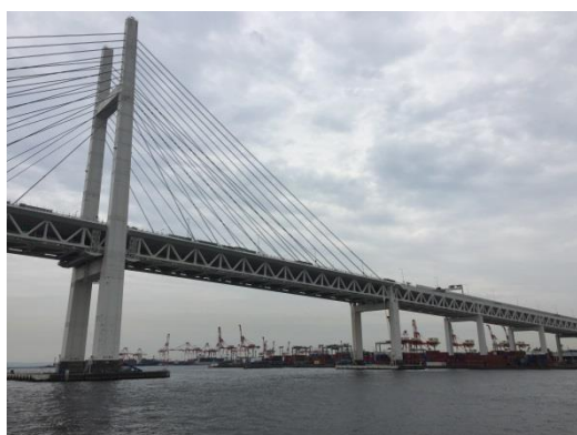
横浜ベイブリッジ