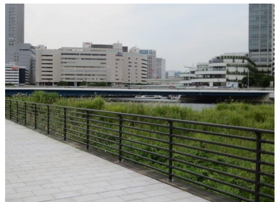
高島水際線公園に隣接するビル群