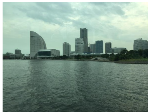
「たかしまⅡ」から見た MM21 地区