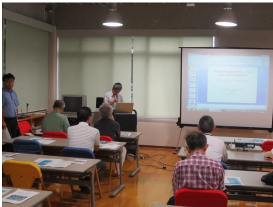
「潮彩の渚」について説明を受ける参加

「潮彩の渚」は、研究機関との協定による協働調査や、一般に公開して、市民向け生物調査の実施、近隣小学生の環境学習の場としても提供されています。