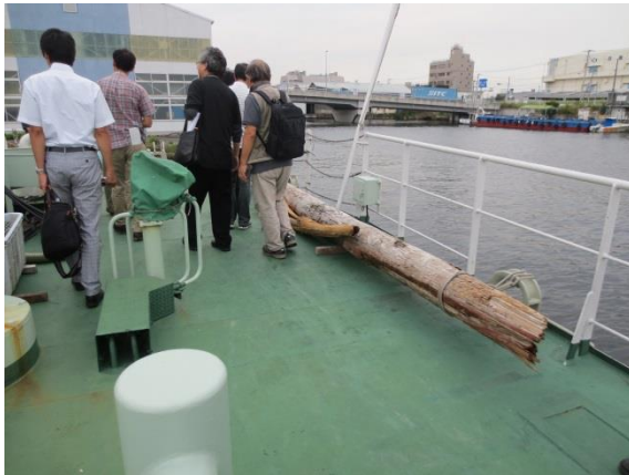
時には、こんな大木が「べいくりん」によって回収されることもあります